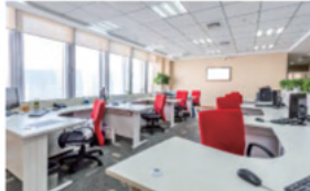
オフィス（フロア・会議室）