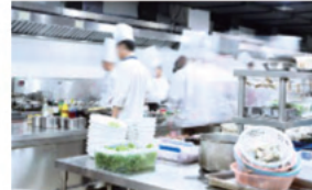
厨房（キッチン）など