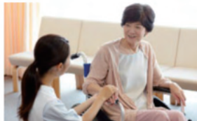
リハビリ施設など