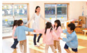
教育施設（保育・幼稚園、託児所）など