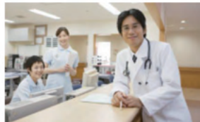
医療施設（医院・クリニック）など